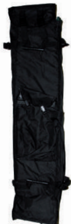
Housse de transport

Visuel fixé avec velcro cotés + velcro haut sur structure aluminium