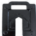
(Option lest de tente) 5 kg